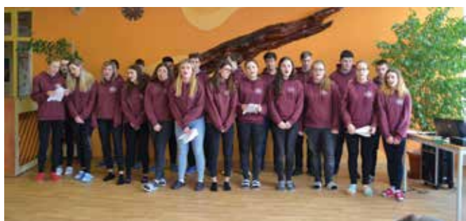
Třída baví třídu – závěrečná píseň devěťáků