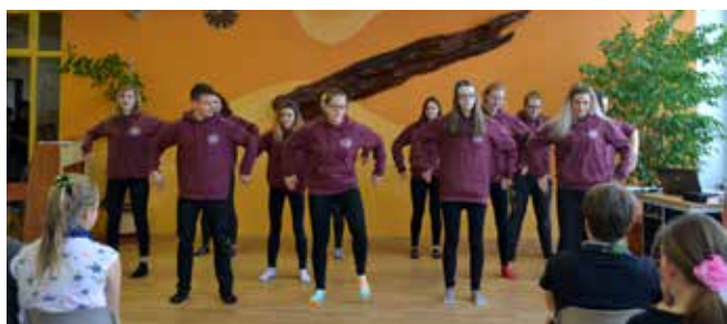
Třída baví třídu – devítka tancuje