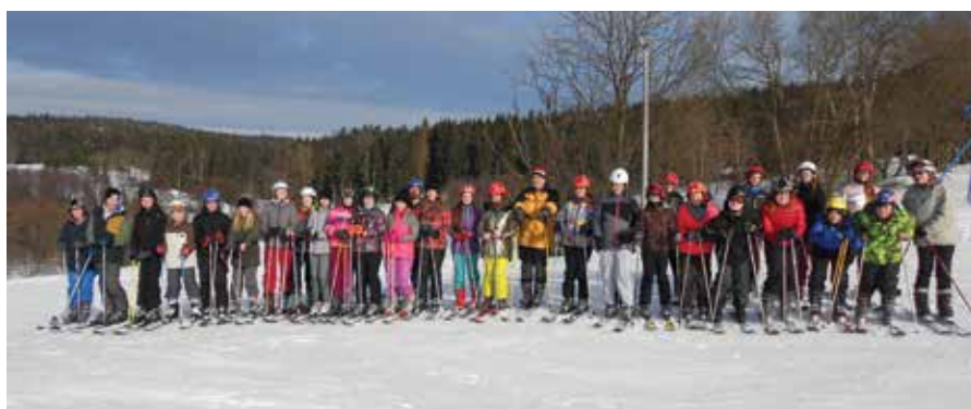
Lyžařský výcvik 7. a 8. třída

Celý školní rok spolupracujeme se Střední školou technickou a obchodní v Dačicích, která pořádá pro žáky okolních základních škol polytechnický kroužek, ve kterém si žáci projektují libovolný výrobek a ten si následně vytisknou na 3D tiskárně.