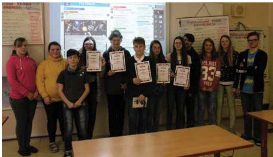
Školní kola olympiády v anglickém jazyce