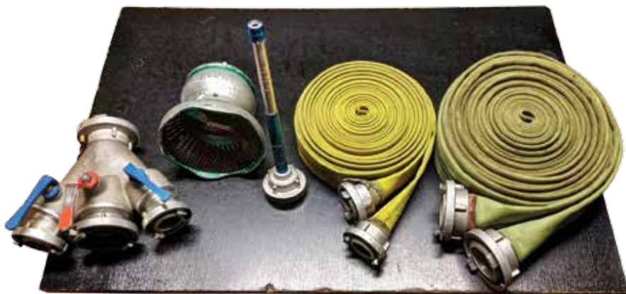
Zleva – rozdělovač, sací koš, proudnice, hadice C, hadice B

Po výstřelu vybíhá ze startovní čáry sedm závodníků k základně, kde je nastartovaná stříkačka (mašina) a ostatní vybavení. Košář a savicář sešroubují dvě savice a koš a připojí na stříkačku. V našem stylu strojník z kádě vodu saje pomocí mašiny, po nasátí přepne páku a tlačí vodu k terčům pomocí hadicového vedení. Hadicové vedení se skládá ze dvou širších hadic B, rozdělovače a čtyř užších hadic C. Hadice jsou na základně smotané v kotoučích a musí být rozhozeny mimo základnu po trati, která měří 70 m. Běčkař rozhodí a spojí hadice B a zapojí do mašiny. Rozdělovač za běhu připojí na konec hadic B rozdělovač, do něj pak levé a pravé hadice C. Proudáři spojí hadice C a nakonec zapojí proudnice. Poté sestříknou terče.