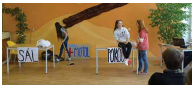
Třída baví třídu – scénka osmáků

Ředitelka Základní školy a Mateřské školy Studená, okres Jindřichův Hradec po dohodě se zřizovatelem oznamuje, že