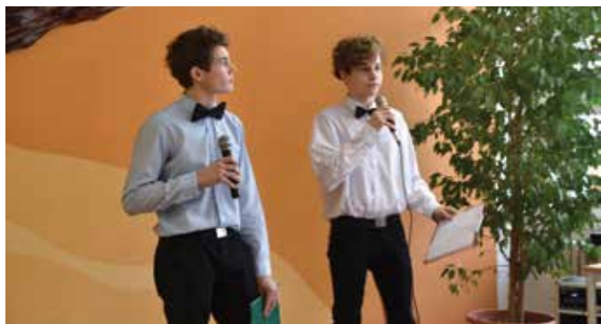
Třída baví třídu – skvělí moderátoři