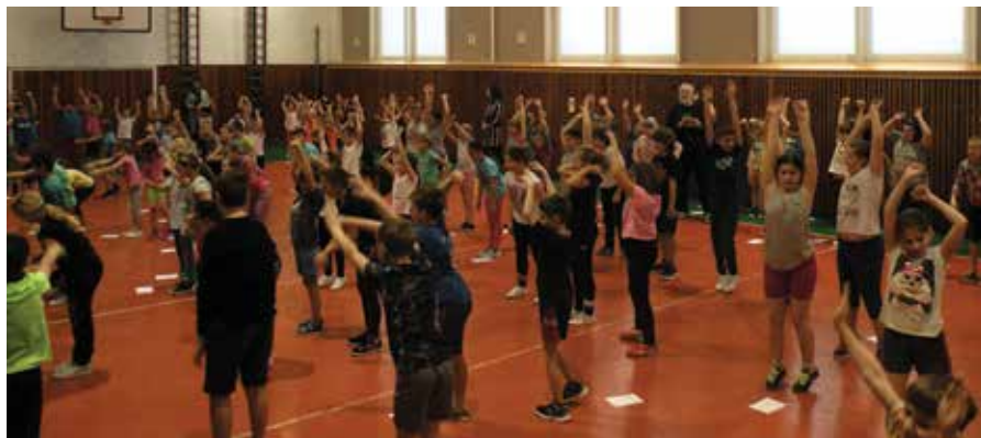
Sportovní dopoledne – 1. stupeň