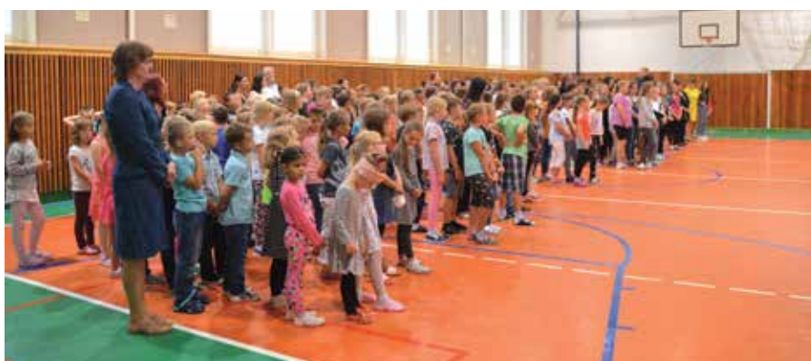
Začátek školního roku 2019/2020