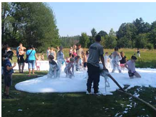
Hasicí pěna a děti v akci