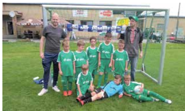
Mladší přípravek po vítězném turnaji v Kunžaku

jsou vykonávány zadarmo a ve volném čase. To je třeba důrazně připomenout.