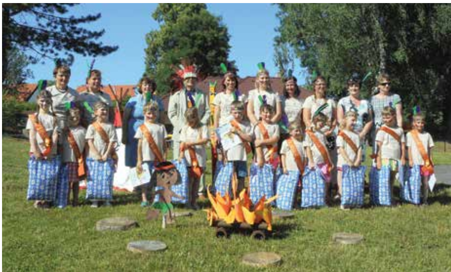
Rozloučení s předškoláky