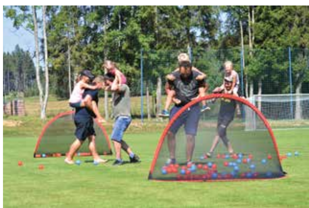
Soutěž na akci rozloučení s prázdninami