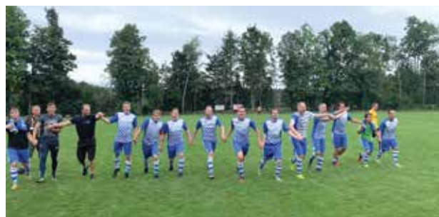
Děkovačka FK Studená

Dále pokračují úpravy na hřišti. Formou brigád se nám daří dále zlepšovat zázemí. V současné době upravujeme nájezd do garáže, na zdech garáže je již štuk, v době vegetace dochází k sečení hřiště třikrát týdně. Poděkování patří obci Studená za finanční podporu a dále zejména těm, kteří se na těchto pracech podílí;