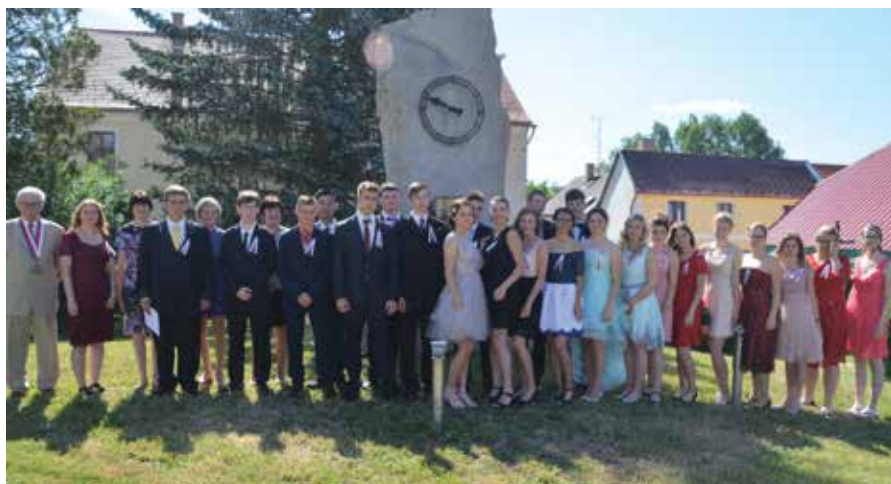
Rozloučení devátáků se základní školou

Prázdniny znamenají pro děti a pedagogy zasloužený odpočinek, pro provozní zaměstnance plno práce. Největší akcí o prázdninách byla rekonstrukce sociálního za-