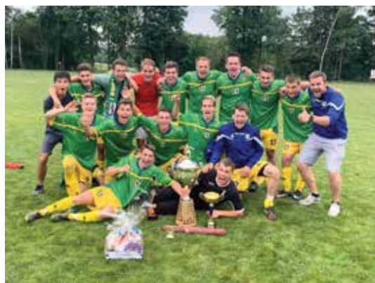
Tým Třebětic po vítězství na Jistuza Cupu

Poslední srpnová sobota patřila nejen fotbalu, ale i dětem, které se loučily s prázdninami. Ve spolupráci s ostatními spolky a Kulturním výborem obce Studená jsme pro ně připravili několik soutěží (střelba na branku, ze vzduchovky, shazování kuželek atd.) o drobné ceny a jako třešničku na dortu