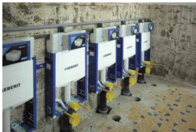
Rekonstrukce dvou tříd v mateřské škole