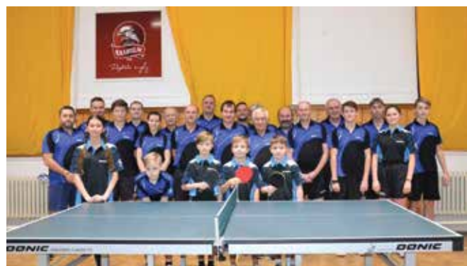
Větší část z 36 členů oddílu při společném focení v polovině sezony 2018/19.

Rozhodně nepatříme k favoritům soutěže, ale poctivě trénujeme a pevně věřím, že budeme hrát v soutěži důstojnou roli. Už jen účast v této soutěži je pro náš oddíl obrovským úspěchem. Budeme velice rádi, když nám přijdete zafandit. Nebojte se přijít a vzít s sebou své děti, uvidíte na jak vysoké úrovni se tento krásný sport ve Studené hraje. Všechny zápasy budou plakátovány na vývěsce obecního úřadu i na vývěs-