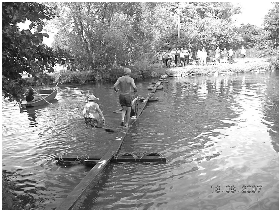
Nahore - rybářské závody v Maršově, disciplína lávka