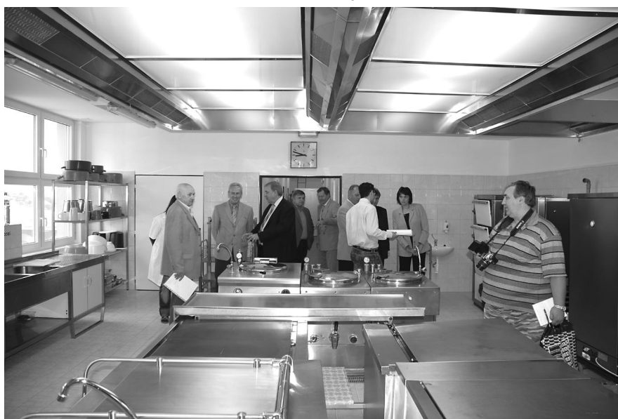
Zařízení nově rekonstruované školní jídelny

- s firmou Řemstavo byla projednána oprava střechy KD Maršov