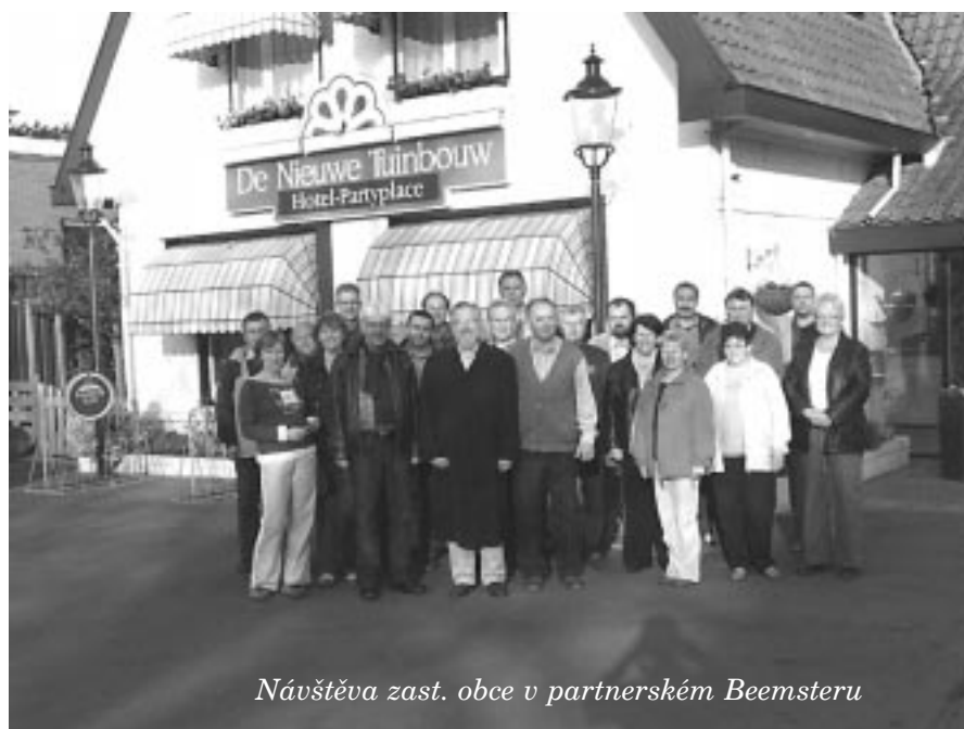
Návštěva zast. obce v partnerském Beemsteru