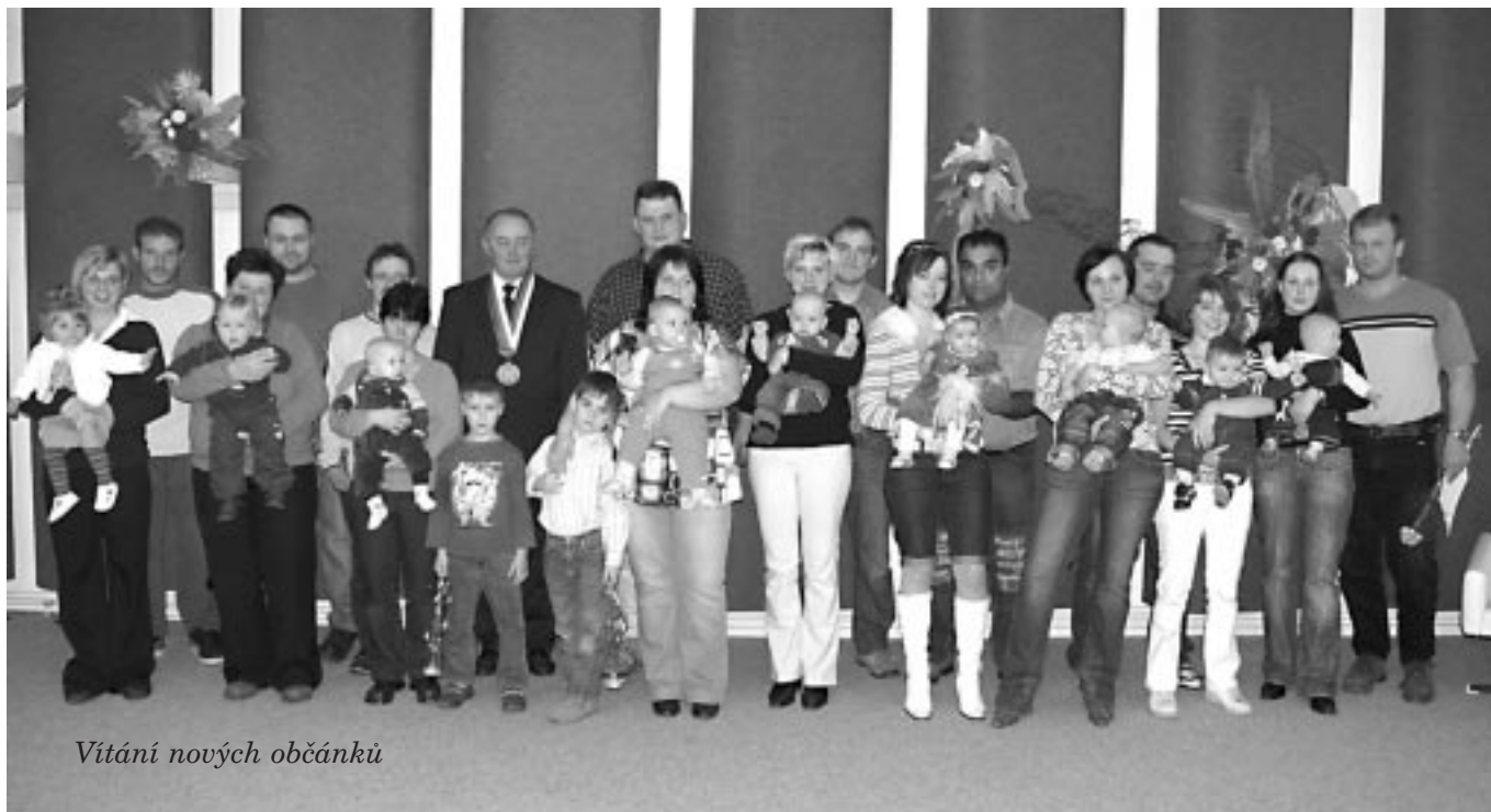
Vítání nových občánků

Nyní k záležitostem, které jsme schopni ovlivnit. Zastupitelstvo obce předalo tři žádosti na dotace z Evropských fondů. Úspěšní jsme byli ve dvou případech, a to získáním dotace na: 1) Rekonstrukci komunikací a náměstí sv. J. Nepomuckého ve Studené, 2) Relaxační centrum v čp.