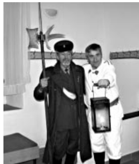
Ponocný v Maršově