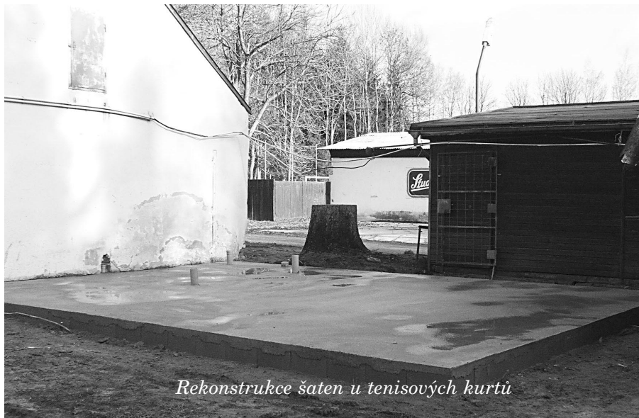
Rekonstrukce šaten u tenisových kurtů