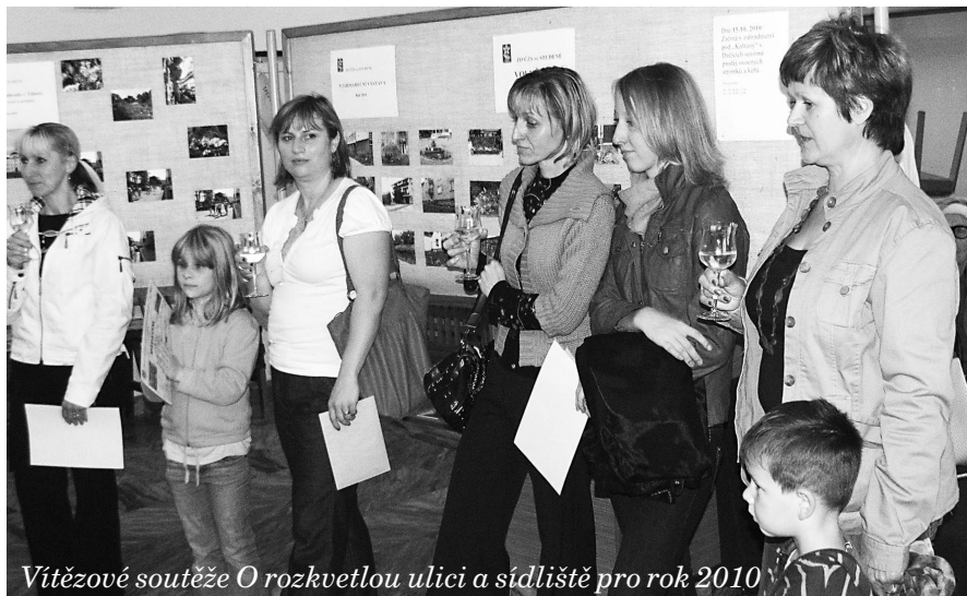
Vítězové soutěže O rozkvetlou ulici a sídliště pro rok 2010

mob.: 725 443 712 Ing. Novák Vratislav Studená 199